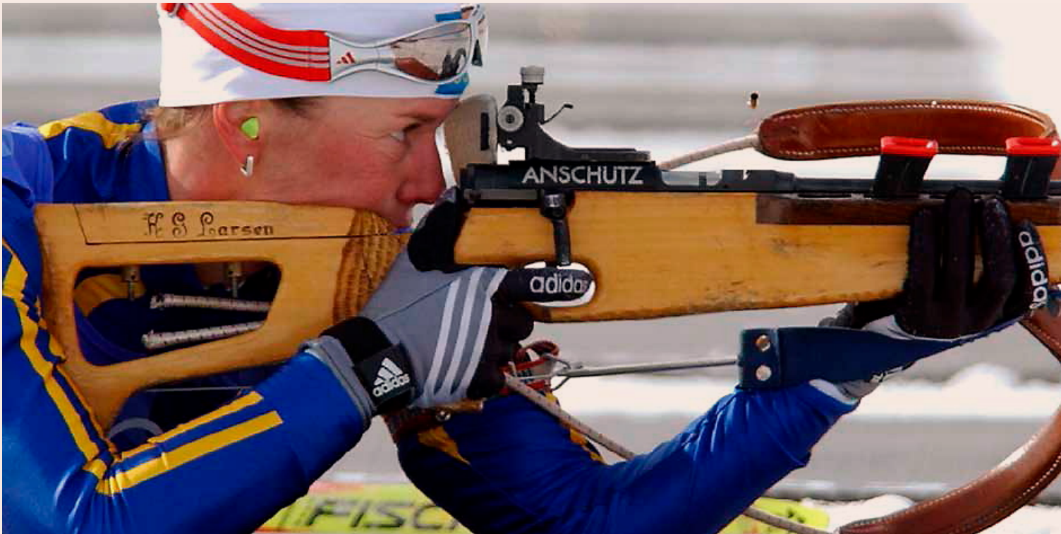
PÅ PALLEN. Magdalena Forsberg avrundade sin skidskyttekarriär med två bronsmedaljer i OS i Salt Lake City 2002.