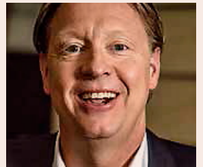
LIKA FÖRBEREDELSE. Hans Vestberg, vd för Ericsson.